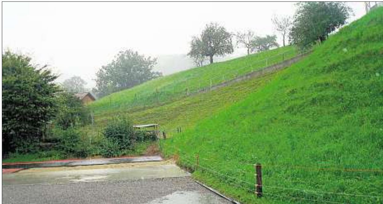
Hier soll das neue Schulhaus entstehen. Dafür muss man die jetzige Sportanlage opfern und ersetzen.

Es soll ein Massivbau mit Minergie-Standard entstehen. Für die Heizung kann, wie für den Kupfentreff, das Wasser des Rickentunnels mit einer Wärmepumpe genutzt werden. Eine Erweiterung in späteren Zeiten wäre möglich. Die Gesamtkosten betragen 2,715 Millionen Franken, die gemäss Abschrei-