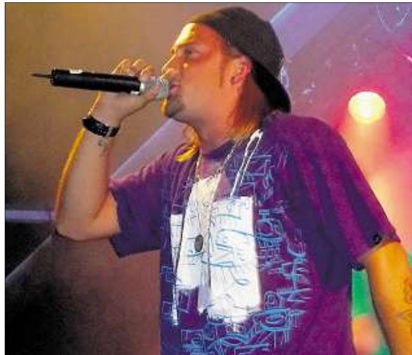
Einer der Höhepunkte des Open Airs: Rapper Lego aus Uznach.