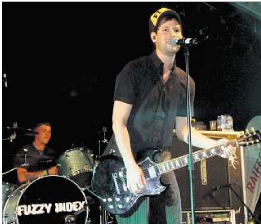
Fuzzy Index aus Zürich rissen das Publikum richtig mit. (Dragiza Stoni)

einheimische Rapper Lego heizte dem Publikum zur späteren Stunde, unter schönstem Sternenhimmel, mit Hip-Hop ein. Aus Basel begeisterte die Sprechgesang-Grösse Brandhård, und die Blues-Rock-Band Stratanova rundete den Abend schliesslich ab. Die Organisatoren sind mit ihrem dritten Open Air sehr zufrieden. Die Stimmung sei grandios gewesen, schwärmte der OK-Präsident, und das Gelände auf dem Parkplatz an der Benknerstrasse optimal. «Am Konzept werden wir bestimmt nicht mehr viel ändern.» Das Open Air soll weiterhin alle zwei Jahre stattfinden.